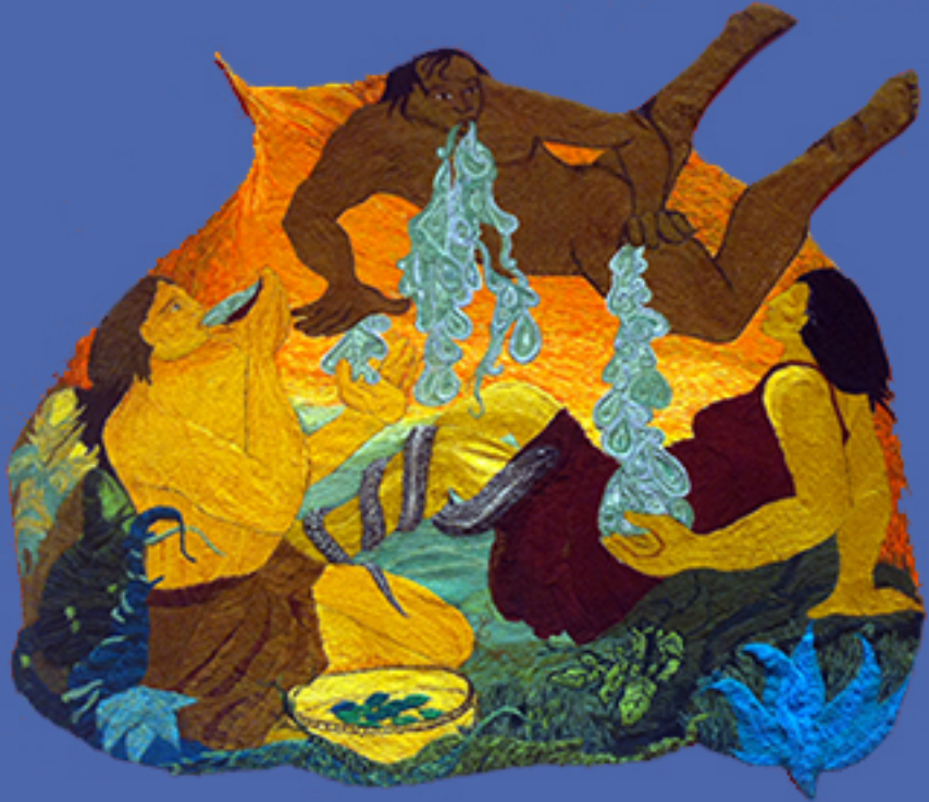
EL TRANCE Técnica crewel

Color, Textura y Trascendencia del Valle de Elqui DRINA SFEIR