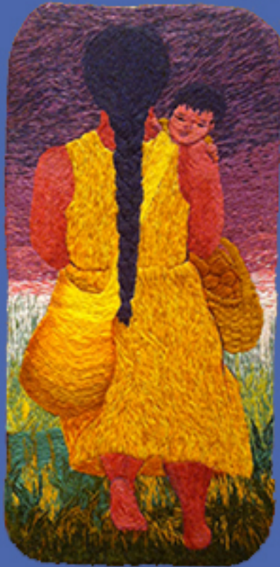
MUJER CON HIJO Técnica crewel