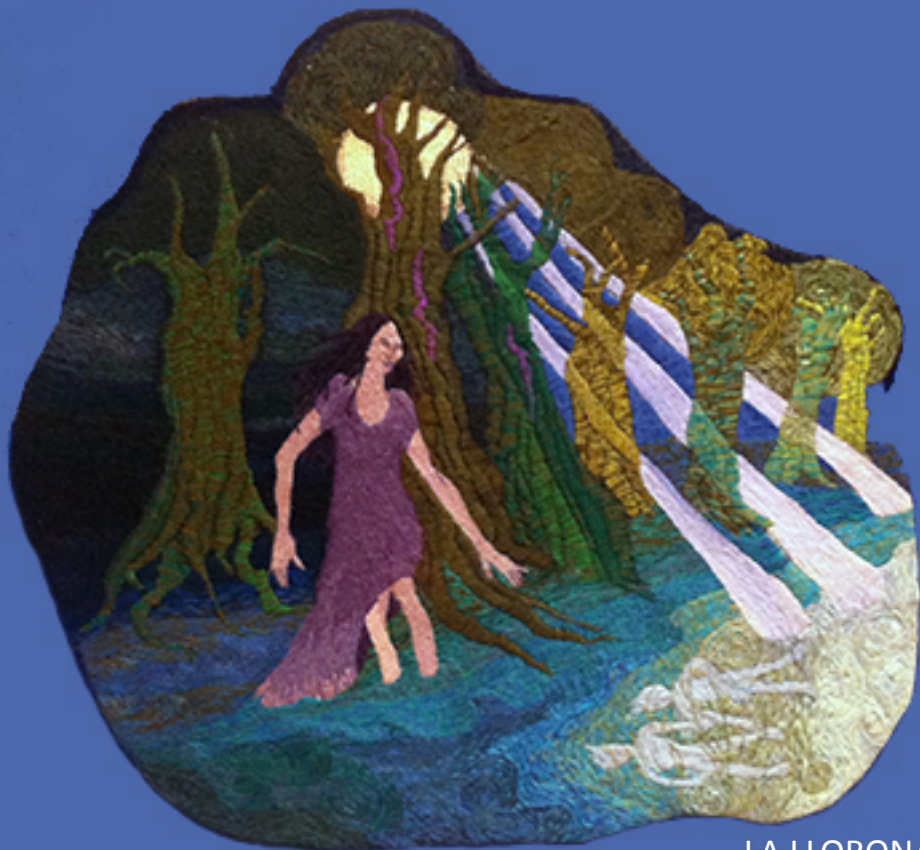
LA LLORONA Técnica crewel