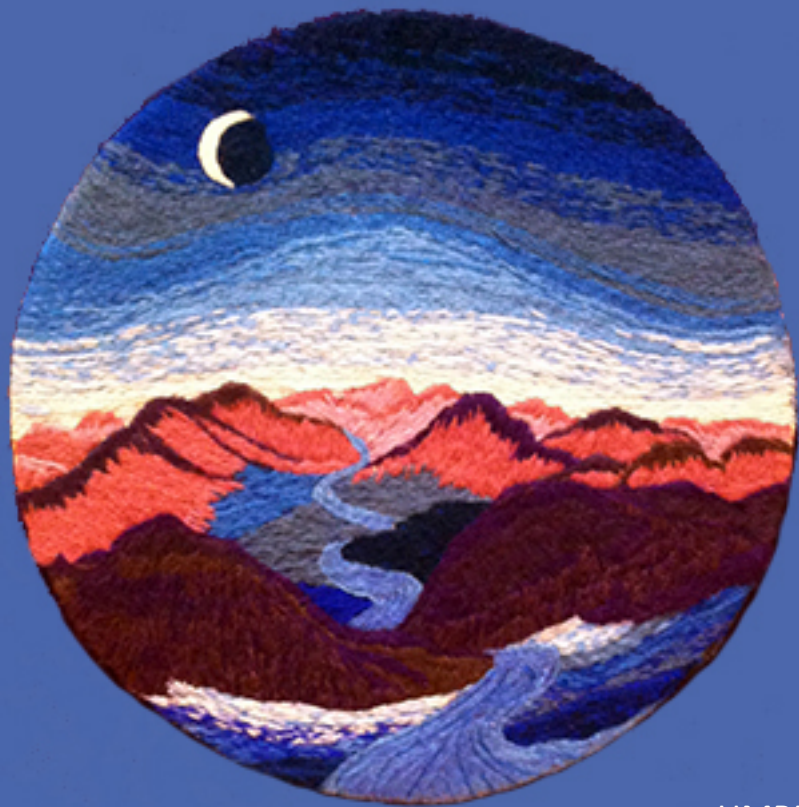
UMBRALES Técnica crewel

Color, Textura y Trascendencia del Valle de Elqui DRINA SFEIR