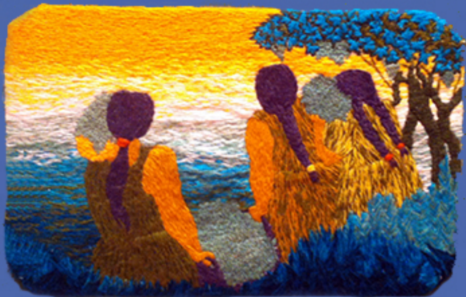
COSECHA DE UVAS Técnica crewel

Color, Textura y Trascendencia del Valle de Elqui DRINA SFEIR