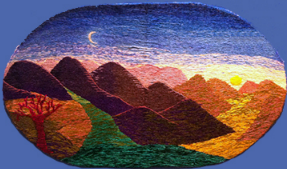
EL PRIMER VALLE Técnica crewel

Color, Textura y Trascendencia del Valle de Elqui DRINA SFEIR