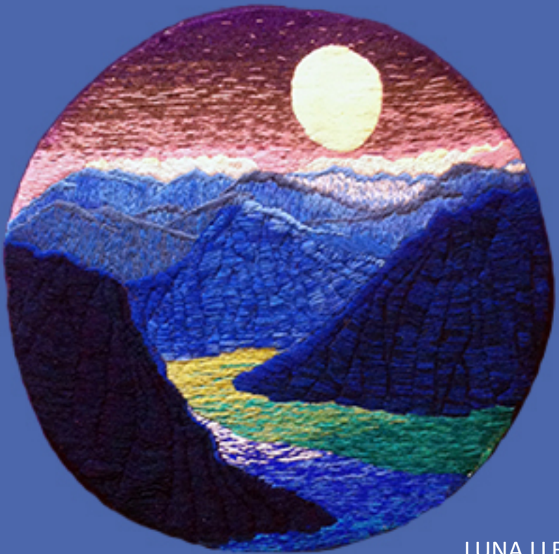
LUNA LLENA Técnica crewel

Color, Textura y Trascendencia del Valle de Elqui DRINA SFEIR